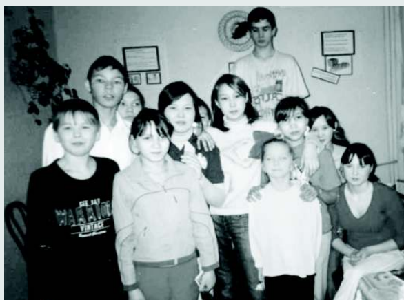
Ребята работали над викториной всем дружным коллективом