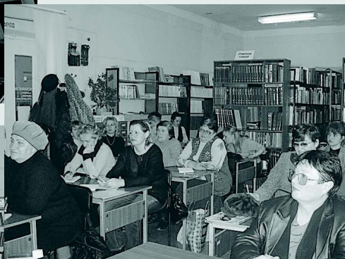
Заседание Дискуссионного клуба «Аграрий»

агропромышленной сферы. Используя в своей работе справочно-правовую систему «Консультант плюс», всем желающим (как сотрудникам аграрной сферы, так и населению Андроповского района) предоставляется информация о выпуске новых правовых актов, касающихся вопросов сельского хозяйства.