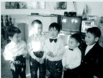
Дошколята читают стихи С. Михалкова.

• 130 лет со дня рождения М.М. Пришвина (книжная выставка, беседа, классные часы).