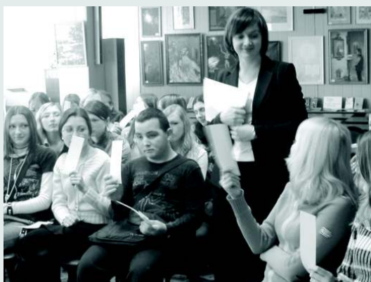
«Дискриминация по признаку пола» Гендерный перекресток с участием психологов и юристов

— «Дискриминация по половому признаку». Гендерный перекресток с участием психологов и юристов.