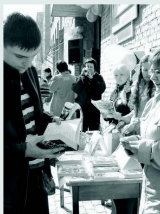
У выставок библиотеки

мана о любимых книгах. Была подготовлена статья для литературной рубрики «Читалка» в республиканском молодежном издании «Твоя параллель». Собственная газетная рубрика — новое «приобретение» библиотеки. Мы и раньше довольно активно публиковались в «Твоей параллели», но открытие отдельной рубрики состоялось именно в 2007 году. Материалы для рубрики готовятся еженедельно.