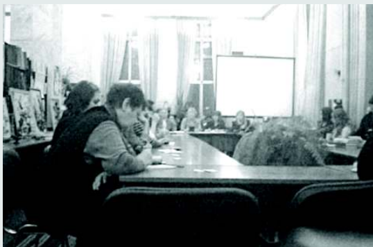
Заседание круглого стола «За чистоту родного города: как изменить «мусорную» психологию горожан»

На круглом столе обсуждались острые, злободневные вопросы утилизации мусора, юридической ответственности граждан за загрязнение мест обитания, вопросы всеобщего воспитания экологической культуры и изменения «мусорного» сознания россиян. Присутствующие узнали,