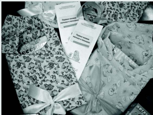
«Каждому ребёнку — книжку и пелёнку»

вариантов помощи маленьким мамам: от мастер-класса по шитью и вязанию детских вещей, — до консультативной помощи стоматолога, юриста, психолога, ведь многие волонтеры оказались специалистами в данных областях.