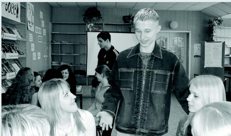
«Понять других сложно, но можно!». Участники тренинга «Как понимать друг друга?»

— «Мужчина и женщина в современном мире»: ролевая игра (или выставка и путеводитель по выставке);