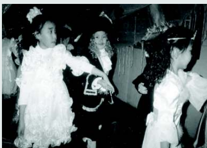
Театрализованное представление, посвященное к 280-летию со дня рождения Ш. Перро