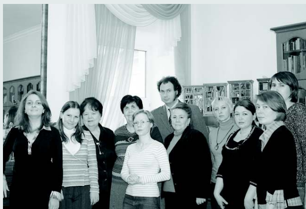
Творческий коллектив проекта «Окно в Россию»

зованной с учетом возрастных психофизиологических особенностей ребенка и подростка, сочетающей библиотечные, музейные, филармонические, зрелищные, экскурсионные и различные интерактивные формы работы, направленные на организацию детского и подросткового досуга, как долговременно, так и краткого.