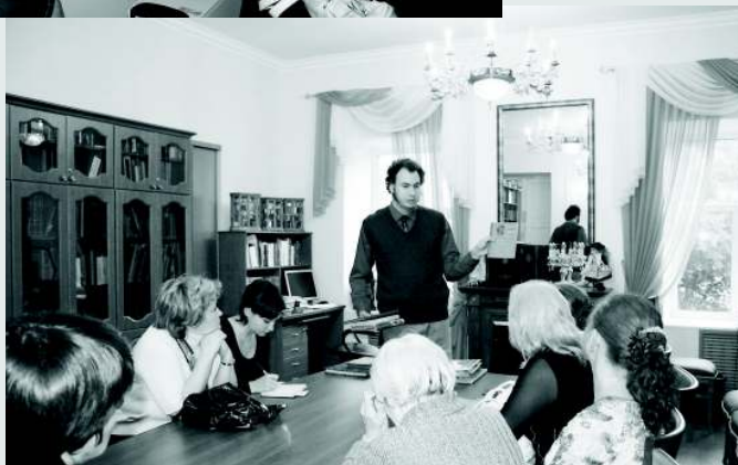
Представители туристических фирм в Пушкинском зале