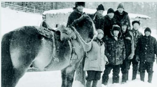
Клуб «Дьэбегей» объединяет коневодов, которые выращивают лошадей якутской породы