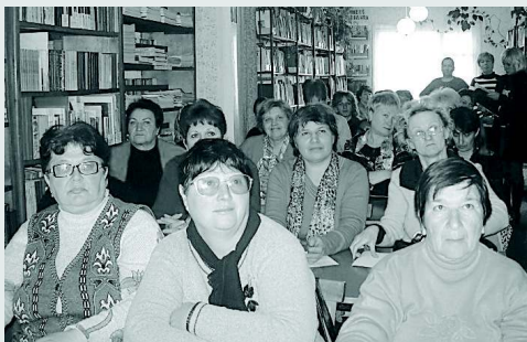
Участники заседания дискуссионного клуба «Аграрий»