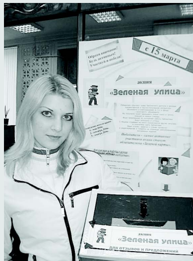
Место сбора отзывов о прочитанных книгах в рамках акции «Зелёная улица»

Активное участие волонтеры принимают также в организации Недели молодежной книги. Они помогают проводить литературные викторины, опросы на улице среди прохожих и в библиотеке, распространяют рекламно-информационную продукцию КомиРЮБ, привлекают нечитающих горожан стать читателями библиотеки. Неделя молодежной книги «Открытия с книгой» в 2008 году была посвящена городу Сыктывкар, Коми краю, ис-