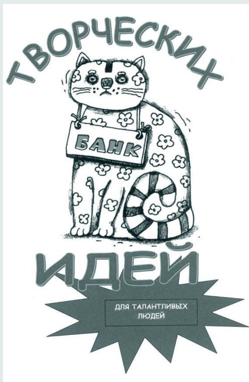
Обложка тематического досье «Банк творческих идей для талантливых людей»

— презентация библиографического указателя «233 идеи для вашего творчества»;