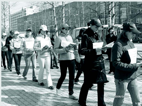
Участники BOOK флэш-моба