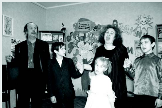
Концерт многодетных семей