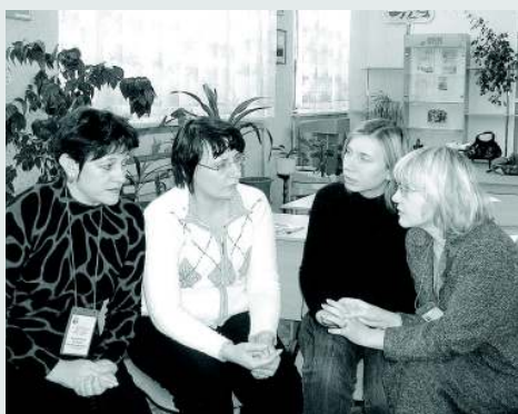
Обучающий семинар-тренинг «Гендерные аспекты чтения». Работа в малых группах