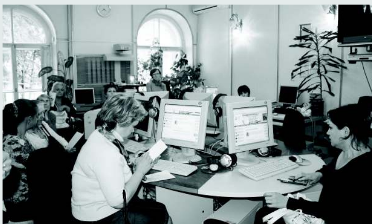
Представители туристических фирм в зале новых технологий

В мае-августе 2008 г. в библиотеке состоялся ряд презентаций ЦГДБ им. А.С.Пушкина как объекта детского образовательного туризма, прове-