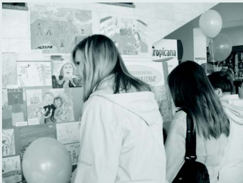
Заключительное мероприятие конкурса «Семейный архивариус»