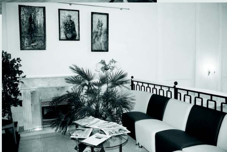
У камина в холле на втором этаже библиотеки

дении экскурсий для детей и взрослых. Планируется организация интерактивных мероприятий для юных читателей. В настоящее время сотрудниками библиотеки разработано несколько комплексных экскурсионных маршрутов по улицам исторического центра Санкт-Петербурга с обязательным тематическим посещением библиотеки: