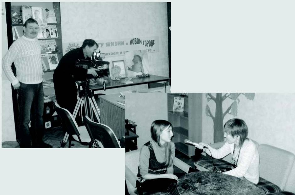
Проект находится под пристальным вниманием местных СМИ

ции семейного клуба для родителей и их малышей, а также создания постоянно действующего координационного центра по информационной поддержке молодых семей. Мы решили продолжать практику рассылок пакетов информационной продукции на случай, если беременная женщина по состоянию здоровья или другим обстоятельствам не может самостоятельно посещать библиотеку. Сотрудничать с нами и после завершения проекта выразили желание многие коммерческие и общественные организации.