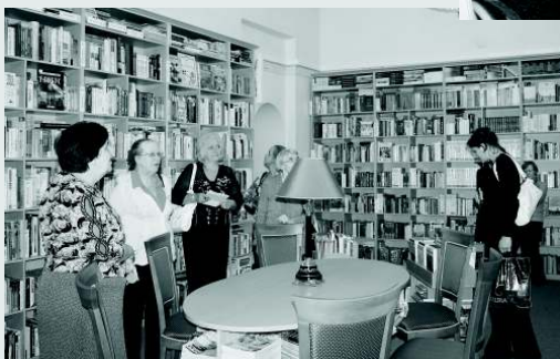
Экскурсия в информационно-образовательном отделе