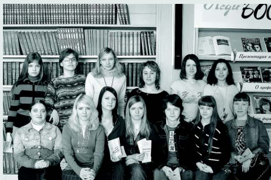
«Как устроиться на работу». Участницы тренинга для выпускниц учреждений профессионального образования