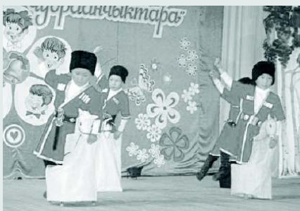
Праздничный концерт, посвященный Дню защиты детей