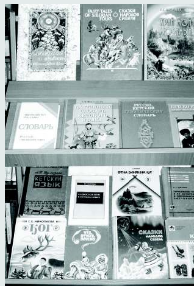
В детской библиотеке открыта выставка по теме проекта