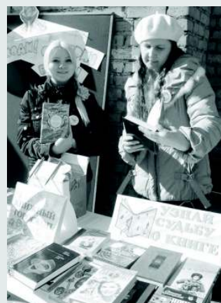
Интерактивная выставка Подходи! Сюрприз будет!