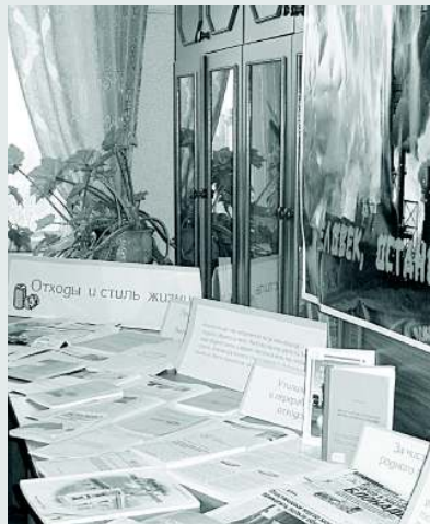
Информационная составляющая круглого стола — выставки