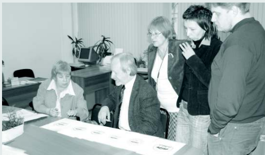
Обсуждение проекта эмблемы конкурса «Лучшее в библиотеках России»