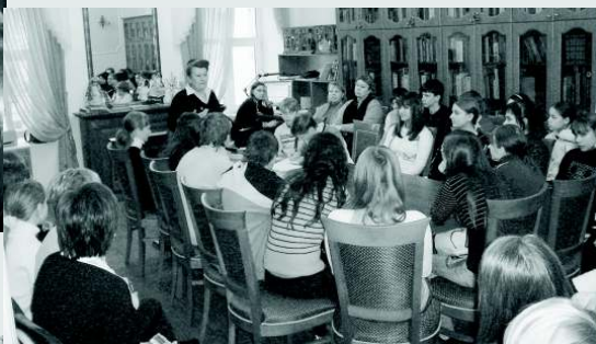
На экскурсии—старшие школьники