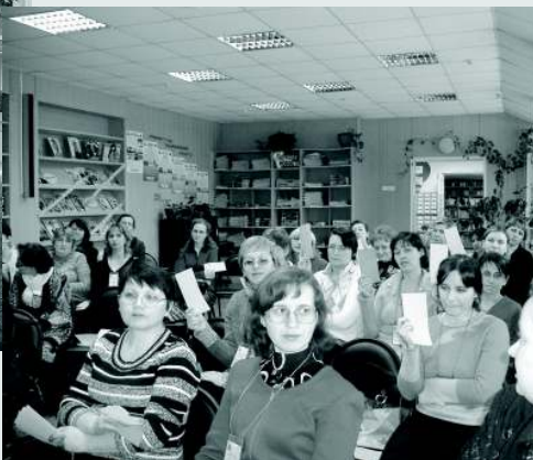
«Гендерный перекрёсток» — интерактивное ток-шоу для профессионалов. Участники

правление, несмотря на его безусловное значение для гармоничного и полноценного развития личности, общества.