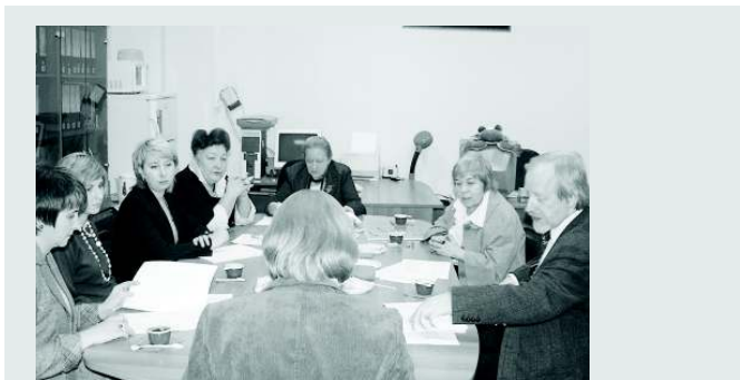
Совместное заседание жюри и оргкомитета конкурса «Лучшее в библиотеках России»