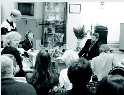
Презентация повести В.Верина «Русский легион» в цикле литературных встреч «Знай наших!»