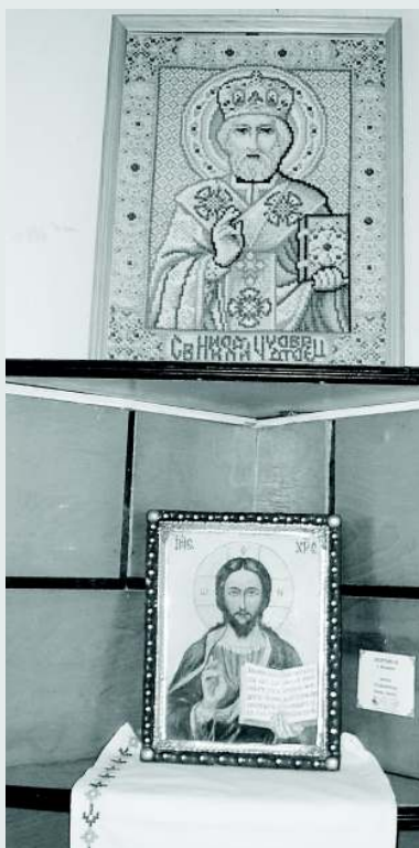
Экспонаты выставки «Православное рукоделие»

удовольствием пообщаться, поделиться творческими новостями и узнать что-то полезное.