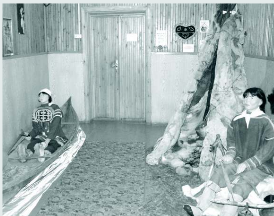
Постоянные экспозиции музея станут образовательной площадкой для маленьких туруханцев