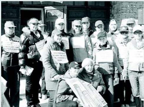
Верные помощники библиотеки — волонтеры. Студенты педагогического колледжа

2. Организация молодежной группы в помощь комплектованию: