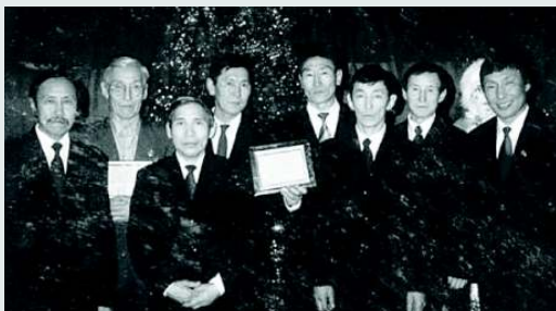
Вокальный ансамбль мужчин «Дуораан»