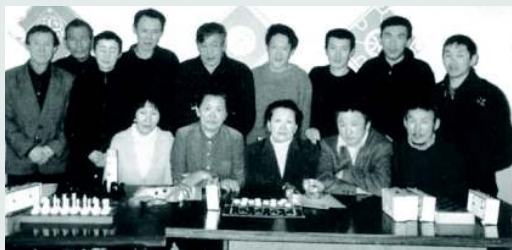
Клуб «Содуба» объединяет любителей шашек и шахмат.