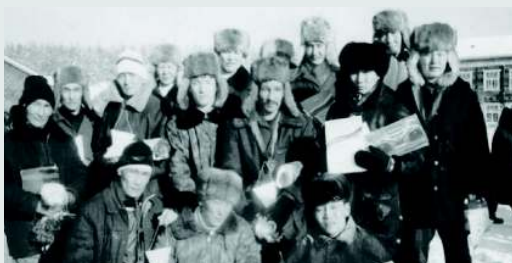
Члены клуба любителей зимнего бега «Аргыс»