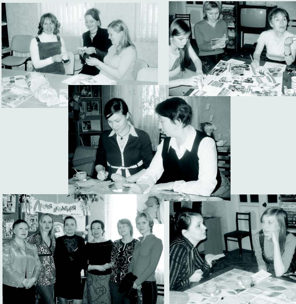
Руководители мастер-классов и индивидуальных занятий с участницами проекта

и благополучные семьи с малышами автономной некоммерческой организации «Партнерство». Они также оставят свои координаты на Деве Добрых Дел.