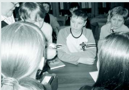
На экскурсии группа школьников из Тольятти

Встречи библиотечарей и родителей в детских садах и школах, выезд на экскурсионном автобусе в популярные среди родителей и детей туристические места города.